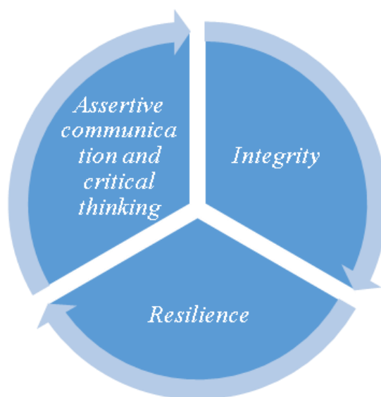
Gambar 1. Diagram Tiga Atribut Program Pendampingan Magang Berkelanjutan.

Aspek employability menjadi dasar dalam pelaksanaan program. Maka, tujuan dari program adalah untuk meningkatkan kemampuan employability calon lulusan Unika Atma Jaya dengan menggunakan tiga atribut yaitu (1) Assertive communication and critical thinking (Kemampuan untuk mengungkapkan diri secara apa adanya namun penuh rasa hormat dan tidak khawatir menggunakan daya kritis), (2) Integrity (Kekuatan dan keberanian untuk bertindak benar sekalipun tidak ada dukungan), dan (3) Resilience (Daya lenting atau kapasitas untuk memulihkan diri dan bertumbuh dari pengalaman yang mengganggu dan menekan). Secara ringkas, disebut “AIR” (lihat Gambar 1).