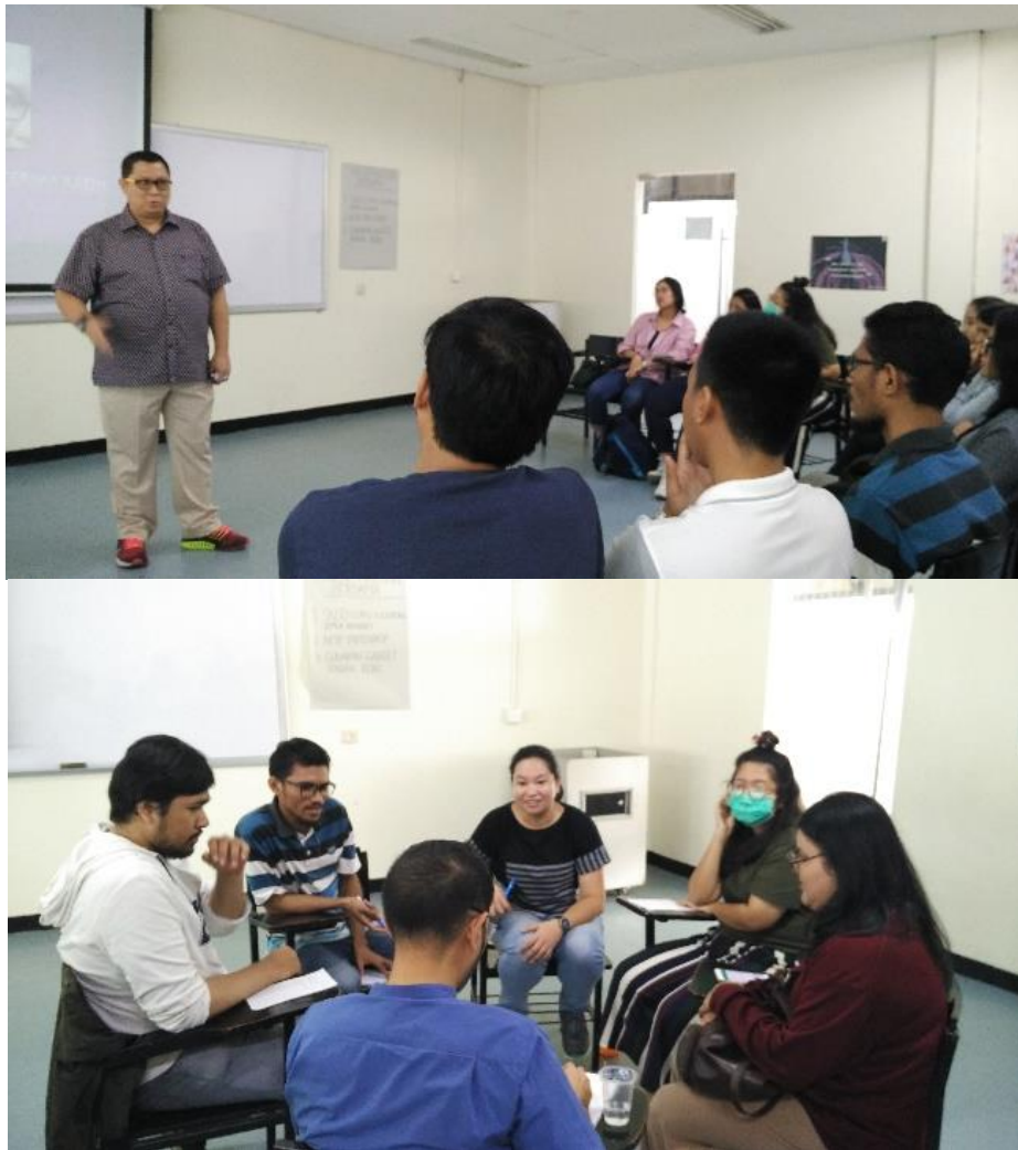
Gambar 3. Foto saat sesi tentang daya lenting disampaikan, kemudian dilanjutkan dengan aktivitas mendiskusikan kasus yang diberikan.