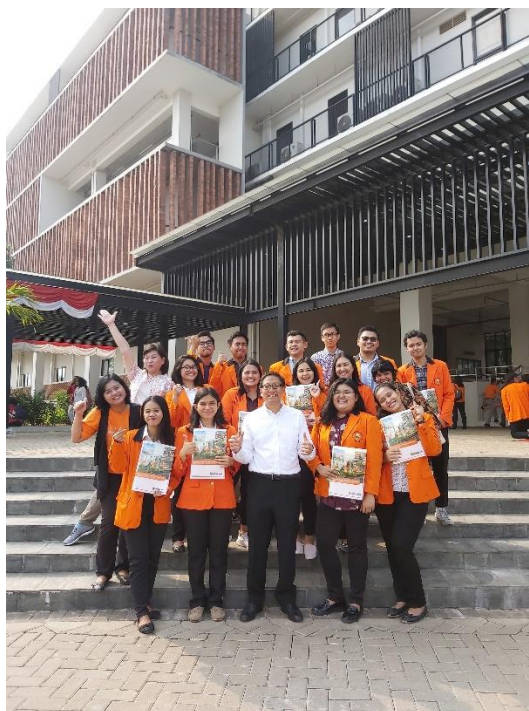
Gambar 5. Saat selesai upacara 17 Agustus 2019 memberikan apresiasi berupa sertifikat SKP.

Saat sesi akhir program pendampingan magang ini, para peserta diminta untuk memberikan evaluasi kegiatan, dan mereka semua setuju jika program ini bermanfaat untuk memberikan bekal selama magang dan persiapan karir. Oleh karena sebagian dari peserta saat proses magang sekaligus menempuh skripsi, dan saat magang selesai, beberapa dari mereka telah selesai skripsi. Beberapa ada yang tertarik untuk balik kembali bekerja di BUMN, ada pula yang ingin mencoba pekerjaan di perusahaan lainnya.