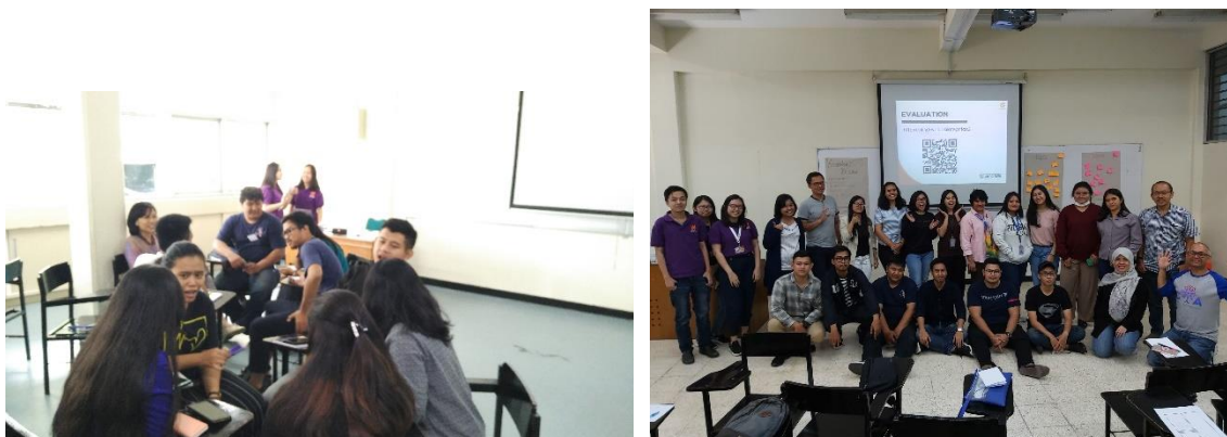
Gambar 4. Sesi sharing bersama kelompok dan mentor, kemudian diakhir acara, berfoto bersama dengan panitia dan peserta.