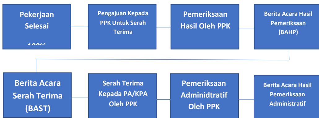
Gambar 2. Alur Serah Terima Pekerjaan

Sesuai dengan Lampiran Peraturan Lembaga Kebijakan Pengadaan Barang/Jasa Pemerintah (LKPP) Nomor 9 Tahun 2018 Tentang Pedoman Pelaksanaan Pengadaan Barang/Jasa Melalui Penyedia, Angka Romawi VIII Serah Terima Pekerjaan, yang merupakan aturan pelaksana dari peraturan Presiden Nomor 16 Tahun 2018, bahwa serah terima pekerjaan dilaksanakan setelah pekerjaan 100% (seratus persen) dari Penyedia kepada Pejabat Penandatanganan Kontrak sampai dengan serah terima hasil pekerjaan kepada Pengguna Anggaran / Kuasa Pengguna Anggaran, yang dijelaskan dalam gambar berikut :