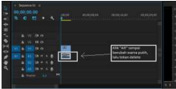
Gambar 4 Menghapus Suara Dari video