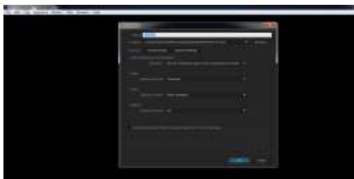
Gambar 1. Tampilan Membuat Project Pada Adobe Premiere Pro CC 2015.3

Pada tahap ini akan dibahas proses penyuntingan sederhana terhadap video yang diambil sebelumnya, dengan terlebih dahulu membuat New Project pada Adobe Premiere Pro CC 2015.3 seperti pada Gambar 1