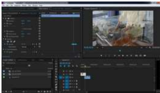
Gambar 5 Tampilan Gelombang Opacity

Pada jendela Timeline geser 1 video ke atas video lain hingga berdempetan dan atur pada "efek control" untuk membuat Efek Fade Transisi tiap video, dan juga memerlukan ketelitian untuk menghasilkan efek transisi yang tidak merusak tempo visual. Seperti pada gambar 5