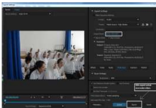
Gambar 6 Export Video

Pada jendela Timeline pastikan seluruh video sudah terseleksi dengan memberikan tanda awal dan akhir [ ] kemudian klik file ekspor -> media. Setelah memilih ekport setting yang tepat penempatannya directory output video klik output name untuk nama video dan klik lagi ekspor seperti pada gambar 6