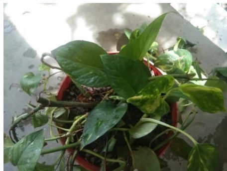
Gambar 10. Tanaman Uji Hari Ke-7

Pada hari ke-6, banyak variasi daun hijau kuning yang sudah berubah menjadi variasi daun kuning, karena kerusakan yang terjadi pada klorofil daun. Ini adalah salah satu efek yang ditimbulkan dari kandungan emisi gas buang kendaraan.