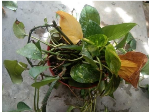
Gambar 5. Tanaman Uji Hari Ke-2

Pada hari ke-1, kondisi tanaman uji mulai menunjukkan kondisi variasi yang berbeda, variasi yang muncul yaitu variasi daun hijau dan variasi daun hijau kuning. Hal ini berpengaruh dengan hasil daya serap timbal yang dibuktikan dengan pengujian laboratorium yang dapat dilihat pada Tabel 1.