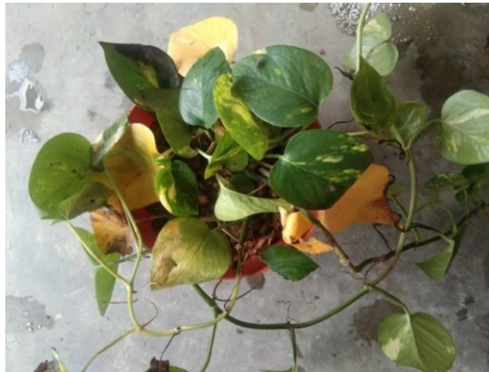
Gambar 11. Tanaman Kontrol Hari Ke-0

Pada hari ke-7, kondisi tanaman uji hanya menyisakan variasi daun hijau, dikarenakan seluruh variasi daun hijau kuning telah berguguran pada hari ke-6.