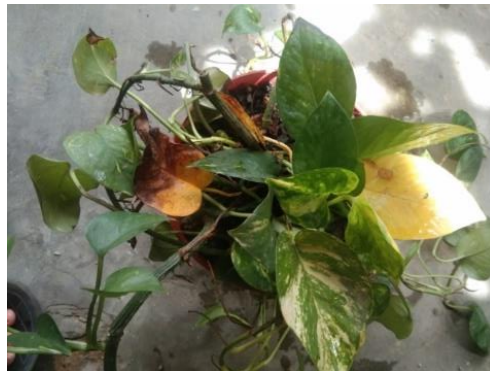
Gambar 8. Tanaman Uji Hari Ke-5

Pada hari ke-4, variasi daun hijau kuning mulai bertambah banyak dan sebagian berubah menjadi variasi daun kuning, dan untuk variasi daun hijau masih relatif banyak.