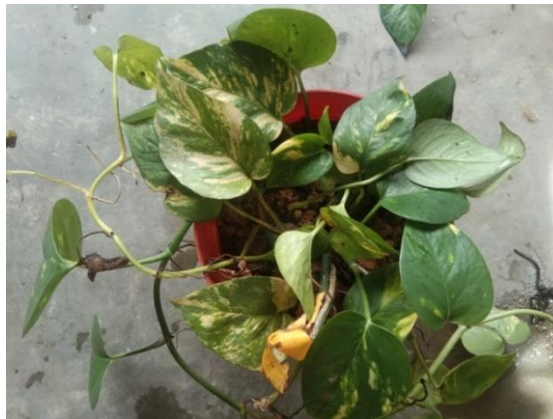
Gambar 12. Tanaman Kontrol Hari Ke-7

Pada hari ke-0, kondisi tanaman kontrol memiliki 3 daun variasi kuning, 5 daun variasi hijau kuning, dan banyaknya variasi daun hijau. Pada hari ke-0 tanaman kontrol menunjukkan hasil 4,806 mg/L. Hasil yang menurun didapatkan pada tanaman kontrol hari ke-7 pengujian yaitu dengan hasil 4,164 mg/L dengan daun yang didominasi dengan variasi hijau kuning.