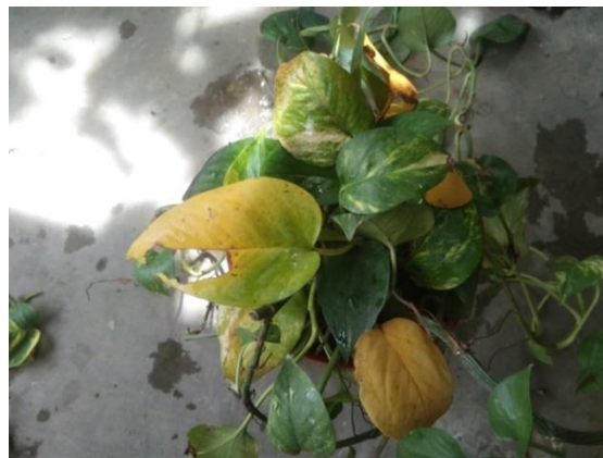
Gambar 9. Tanaman Uji Hari Ke-6

Pada hari ke-5, terlihat adanya peningkatan daya serap daun terhadap emisi gas kendaraan. Hal ini menunjukkan bahwa banyaknya variasi daun hijau dan beberapa variasi daun hijau kuning berpengaruh besar dalam penyerapan emisi gas kendaraan.