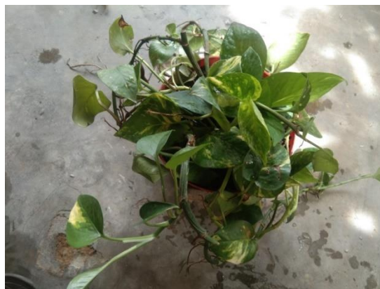
Gambar 4. Tanaman Uji Hari Ke-1

Dilihat dari tanaman uji pada hari ke-0, kondisi tanaman yang didominasi dengan variasi daun hijau. Pada hari ke-0, tanaman belum menyerap emisi gas dari kendaraan bermotor.