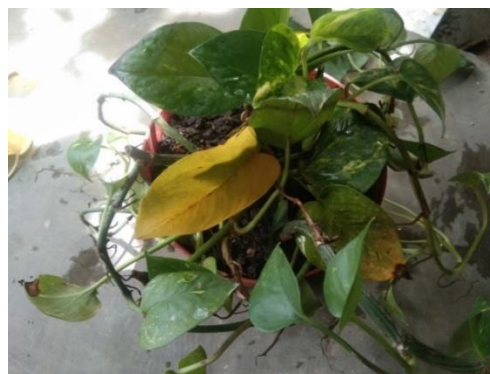
Gambar 7. Tanaman Uji Hari Ke-4

Pada hari ke-3, kondisi tanaman uji hanya menyisakan variasi daun hijau kuning dan variasi daun hijau, hal ini disebabkan karena variasi daun kuning telah dibersihkan pada hari ke-2 pengujian. Diduga karena variasi daun kuning, maka zat hijau daun sudah tidak berfungsi lagi dan mengindikasikan kerusakan pada daunnya.