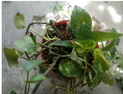
Gambar 6. Tanaman Uji Hari Ke-3

Pada hari ke-2, kondisi tanaman uji mulai menunjukkan variasi baru, yaitu variasi daun kuning, dan terlihat bertambahnya jumlah variasi daun hijau kuning dan ada beberapa variasi daun hijau.