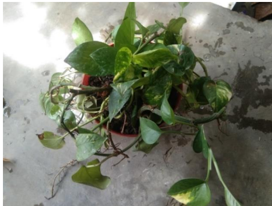
Gambar 3. Tanaman Uji Hari Ke-0

Pada tanaman uji Sirih Gading ( Epipremnum aureum ) yang sedang diuji terdapat beberapa kondisi pada bagian daunnya. Kondisi fisik yang menjadi fokus utama dalam pengujian ini adalah pada bagian daun. Kondisi fisik daun tersebut yaitu variasi daun hijau, variasi daun kuning hijau, dan variasi daun kuning. Pada masing-masing variasi daun memiliki kemampuan penyerapan Pb yang berbeda-beda. Daya serap Pb dipengaruhi oleh beberapa faktor eksternal dan internal. Faktor internal yang mempengaruhi kadar Pb dalam daun tanaman antara lain bentuk dan ukuran daun, jumlah klorofil daun. Pada variasi daun hijau memiliki jumlah klorofil daun yang lebih banyak dibandingkan dengan variasi daun hijau kuning dan variasi daun kuning. Pada faktor eksternal yang berpengaruh antara lain, jarak tanaman dengan sumber pencemar, dan faktor lingkungan (kadar Pb di udara, suhu udara, kelembaban udara, dan intensitas cahaya). Namun pada penelitian ini faktor lingkungan tidak diutamakan, karena hanya menggunakan satu jenis tanaman yang diletakkan ditempat yang sama dan diberikan perlakuan yang sama setiap harinya (pemberian air secara rutin setiap hari) sehingga faktor lingkungan bisa diminimalisir.