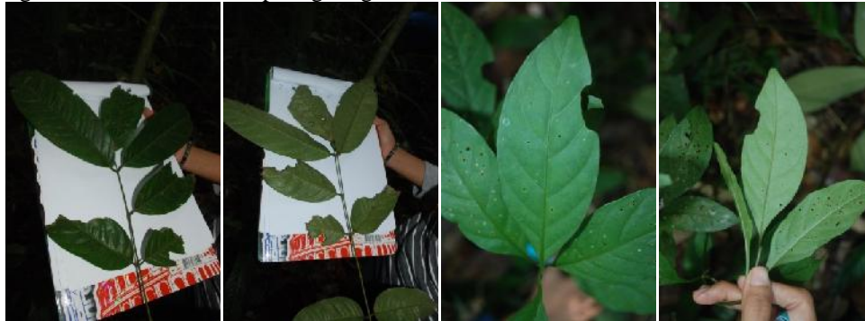
Gambar 3. Jenis dominan pada tingkat pertumbuhan pancang Fordia splendidissima (Miq.) Buijsen (Fabaceae) (kiri); jenis dominan pada tingkat pertumbuhan semai Psychotria viridiflora Reinw. Ex Blume (Rubiaceae) (kanan)

yang lebih tinggi. Begitu pula dengan jenis Fordia splendidissima (Miq.) Buijsen dari kelompok Fabaceae yang memiliki karakteristik cepat tumbuh atau fast growing jenis dan berpotensi tinggi untuk digunakan sebagai jenis-jenis revegetasi lahan pasca tambang, karena jenis ini secara alami sudah beradaptasi dengan kondisi pH rendah (Adman et al , 2012). Dan jenis-jenis dari kelompok Rubiaceae menghasilkan banyak biji, sehingga memudahkan penyebaran dan perkembangbiakan. Hal ini yang menyebabkan pertumbuhan permudaannya cenderung berlimpah dan berpotensi mendominasi kawasan (Lubis, 2008). Sedangkan untuk tingkat pertumbuhan semai dapat dilihat pada Tabel 4.4 di bawah.