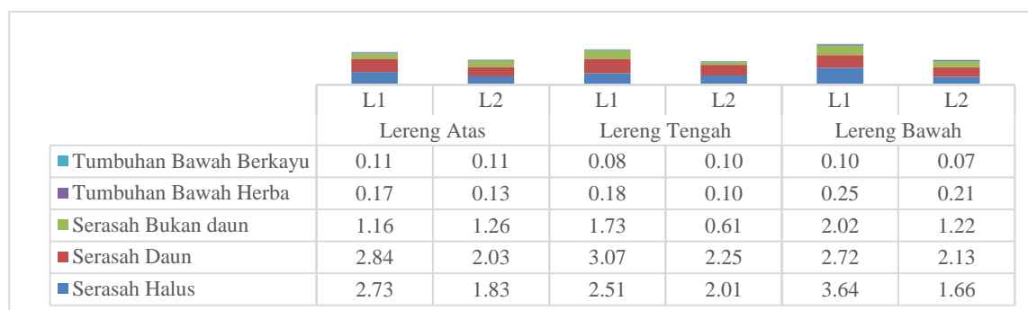
Gambar 3. Distribusi Cadangan C Tumbuhan Bawah dan Serasah Hutan Sekunder Muda HPFU dengan Kemiringan Landai (L1) dan Agak Curam (L2).

daerah dengan kemiringan landai kontribusi terbesar diperoleh dari serasah halus. Adapun kontribusi terkecil diperoleh dari komponen serasah bukan daun. Selanjutnya untuk cadangan C dalam tumbuhan bawah, kontribusi tumbuhan bawah herba lebih besar dibanding tumbuhan bawah berkayu. Kondisi tersebut terjadi pada semua posisi lereng baik pada daerah landai maupun agak curam.