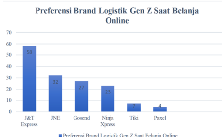
Gambar 1. Layanan Ekspedisi yang Menjadi Preferensi Gen Z Saat Belanja Online

Beberapa tahun kebelakang jasa ekspedisi mengalami peningkatan pengiriman yang signifikan, apalagi sejak diterpa virus covid-19 . Di Indonesia ada beberapa perusahaan jasa pengiriman seperti J&T Express, JNE, Tiki, Anteraja, GoSend dan seterusnya. Tetapi dalam kasusnya perusahaan J&T Express yang mendapatkan perhatian lebih oleh para penjual dari tempat belanja online sebanyak hampir 60% seperti yang disajikan dalam tabel berikut.